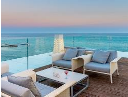
OCIO Y ANIMACIÓN