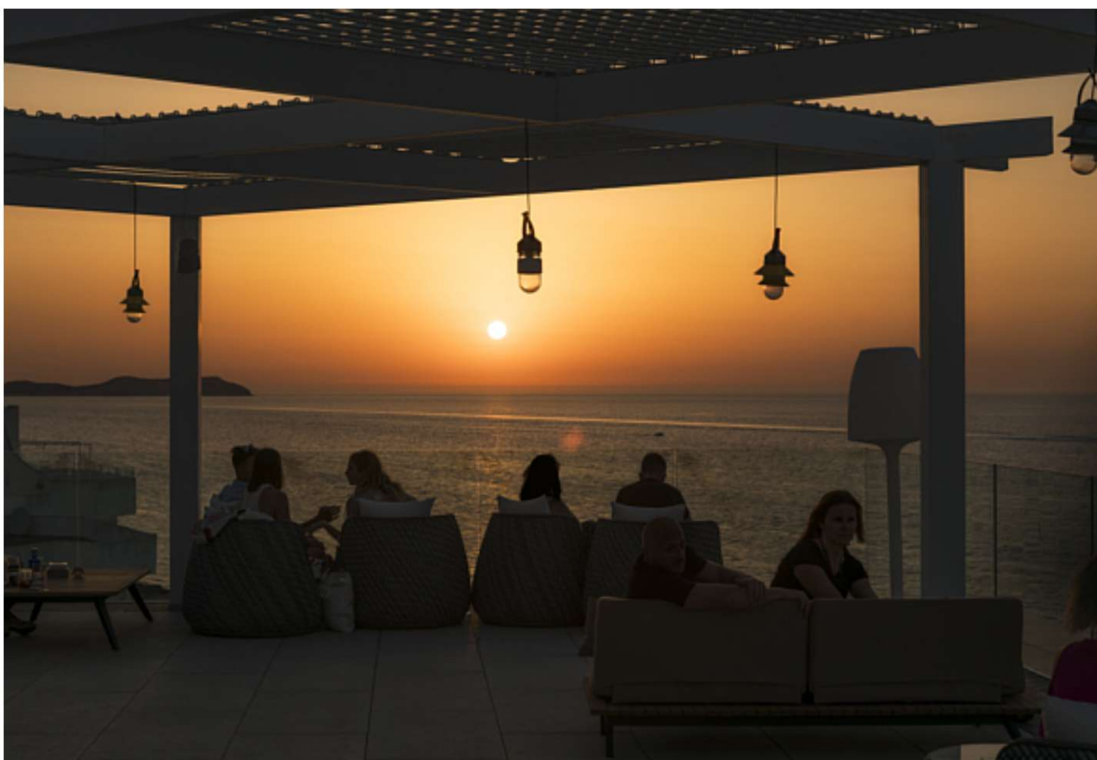
Atardeceres para enamorarse de nuevo en el Sunset Ritual de Amàre

Este paraíso para mayores cuenta con 366 habitaciones y destaca por sus vistas al Mediterráneo. Además posee una fabulosa piscina infinita en su azotea y dos piscinas más al aire libre. Dispone de un bar de cócteles en su rooftop con música en vivo y tres restaurantes, así como un club de playa .